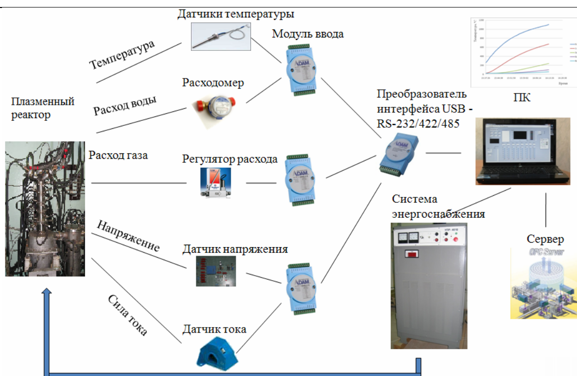
Рис.2. Программно-аппаратный комплекс по управлению установкой.

Для сбора и обработки данных использовался специально разработанный программно-аппаратный комплекс (рисунок 2).